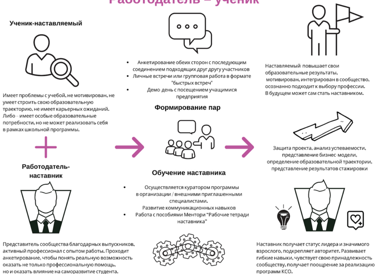
Рисунок 4. Графическое представление реализации программы наставничества по форме «работодатель – ученик».